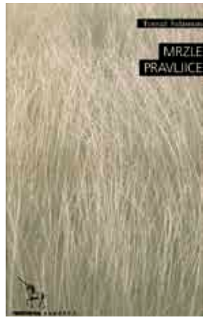
Tomaž Šalamun, Mrzle pravljice, Nova revija