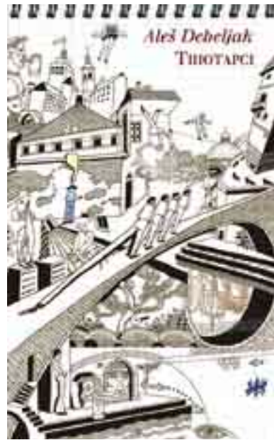
Aleš Debeljak, Tihotapci, Mladinska knjiga

Spominjam se, da sem pred osemindesetimi leti prebrala njegovo prvo knjigo Pojoči grm (DZS, 1961) in spominjam se dveh pesmi, s katerima je začrtal najširšo domišljijjsko razsežnost pesništva. Prva je antološka Maj,ta "čudovita klepsidra petja" v kateri "Glas podaja roko/ glasu./ Misel misli./ pesem pesmi." Druga pa Smrt, v kateri zadnje besede nima nihilistična instanca, značilna za tisto obdobje. V njegovi pesmi je več vrst smrti: "Smrt ptic, / smrt vode, / smrt snega, / smrt vetra. (Človekov duh/ gre kot čarovnik/ mimo grobov)." Te tri zadnje verze pesmi je dal v oklepaj. Želel je,