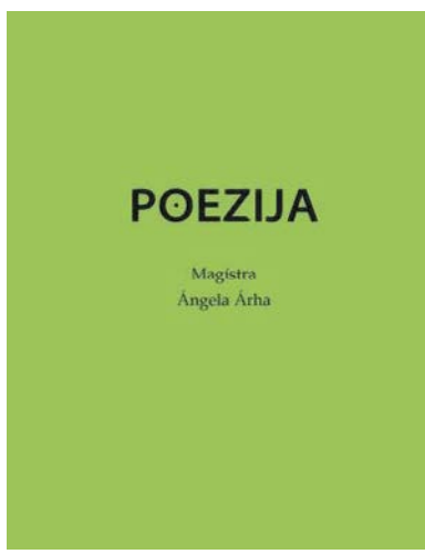
Založba Miramel, 2015