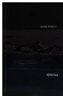
Matej Krajnc: Ojstrica (SZ Čeljust)