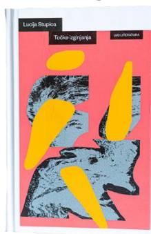
Lucija Stupica: Točke izginjanja (LUD Literatura)