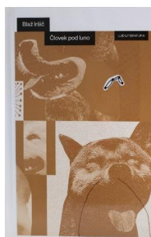
Blaž Iršič: Človek pod luno (LUD Literatura)